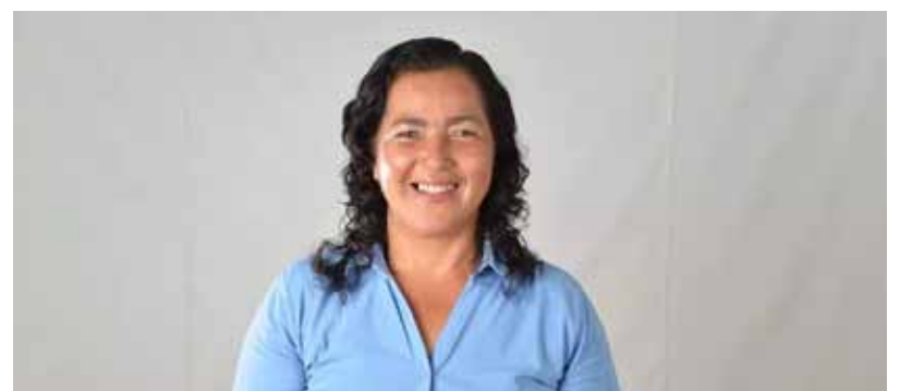
Elsa Candia Quiroz Alcaldesa Municipio de Pampa Grande

La Alcaldesa planteó "un mejor control para evitar que los insumos ilícitos lleguen a las manos de los productores, que quizás por un precio económico o engaños por una etiqueta falsa, que no dice lo que contiene el producto, y se pongan en riesgo los cultivos que alimenta a Santa Cruz y a Bolivia" señaló Candia que los productores no solo sufren de este tipo de engaños, sino también los bajos precios, ahondado aún más las pérdidas.