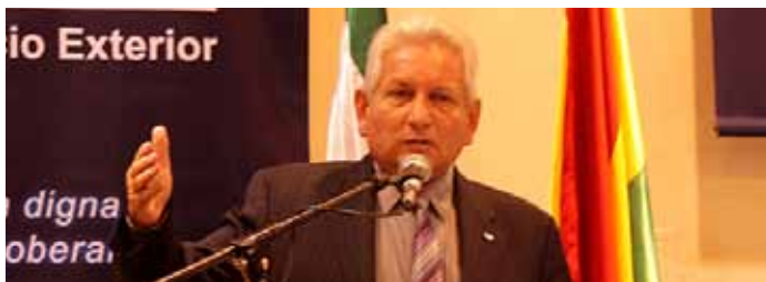
EXTRACTO DEL DISCURSO DEL GOBERNADOR DEL DEPARTAMENTO DE SANTA CRUZ AGR. RUBÉN COSTAS AGUILERA

Estamos seguros que este nuevo Directorio seguirá acompañando al empresariado nacional, ofreciéndole cada vez mejores servicios, apoyando de ese modo al desarrollo de Santa Cruz y el país.