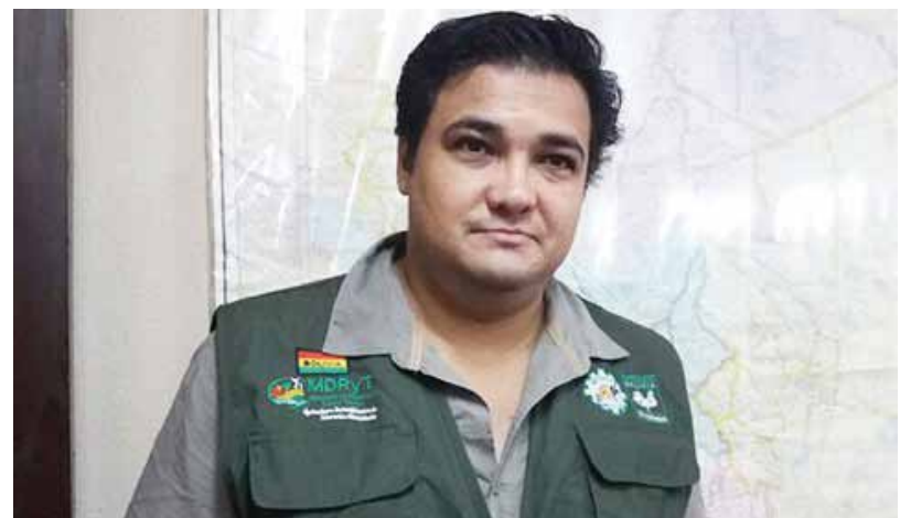
Dr. Javier Suárez Hurtado Director Ejecutivo Servicio Nacional de Sanidad Agropecuaria e Inocuidad Alimentaria - SENASAG

La misión institucional del SENASAG, es administrar el régimen específico de sanidad agropecuaria e inocuidad alimentaria en todo el territorio nacional; cuyas atribuciones son las de preservar la condición sanitaria del patrimonio productivo agropecuario y forestal, el mejoramiento sanitario de la producción animal y vegetal y garantizar la inocuidad alimentaria en los tramos productivos y de procesamiento del sector agropecuario.