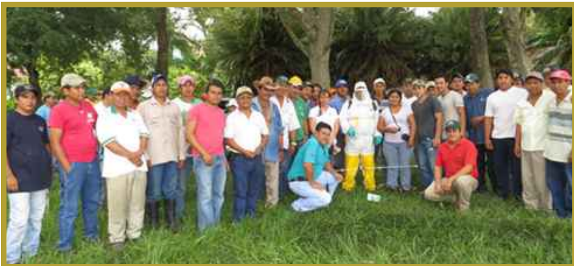
Taller CIAT - Municipio de Saavedra (04/02/15).

El 13 y 14 de Marzo se participó en la "Feria de la Soya", organizada por ANAPO en su Centro Experimental del Municipio de Pailón. En fechas 23 y 24 de Octubre, se participó en la "Feria VIDAS", organizada por FUNDACRUZ, en el Municipio de Warnes del Departamento de Santa Cruz.