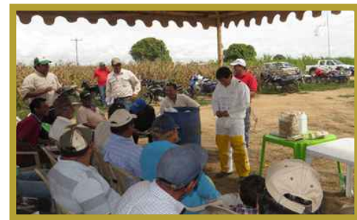
Municipio de San Pedro (25/03/15)