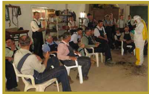
Municipio de Pailón (13/02/15)

Ocupacional, Toxicología, Tecnología de aplicación, Manejo Integrado de Plagas, y Gestión Integral de Residuos.