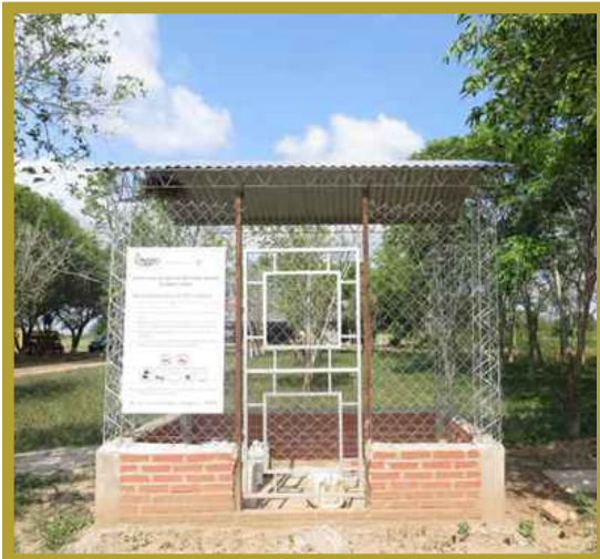
Centro de Acopio ANAPO (Santa Cruz)

Destacar también el esfuerzo realizado en la construcción de los Centros de Acopio de las entidades: ANAPO, Acresud, Intagro y La Castaña.