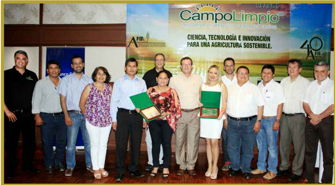
Distinciones en la 10ma. versión del Día Nacional "Campo Limpio" (30/10/15)