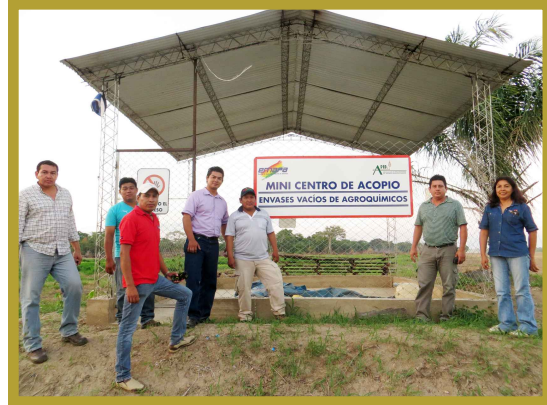
Centro de Acopio EMAPA (Beni)